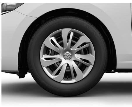
OBRĘCZE STALOWE 15