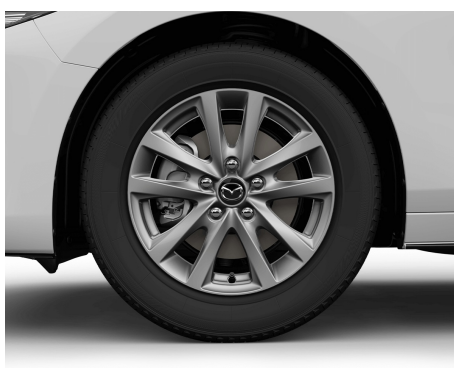
FELGI ALUMINIOWE SILVER (16)