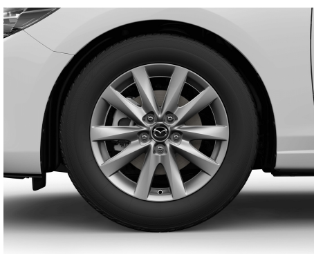
OBRĘCZE ALUMINIOWE 17 GUN METAL