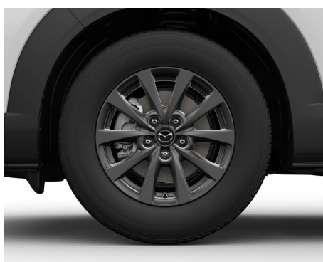
FELGI ALUMINIOWE GRAY 16