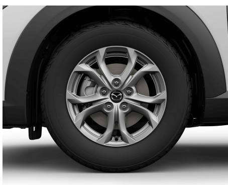
OBRĘCZE ALUMINIOWE SILVER 16