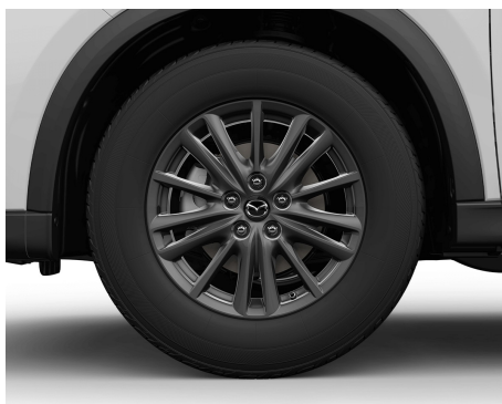
KOŁA 225/65R17 NA FELGACH ALUMINIOWYCH GRAY